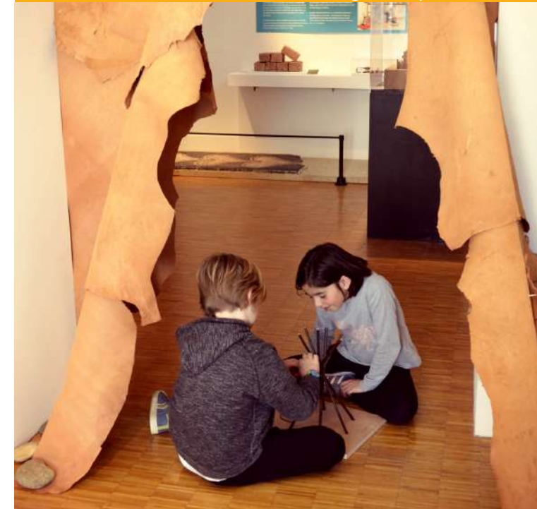
Musée d'archéologie tricastine - EPIC Saveurs et patrimoines